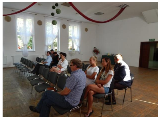
Gmina Jabłonowo Pomorskie